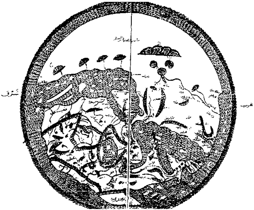
صورة الأرض، مخطوطة عاطف أفندي 1936

ولنرسم بعد هذا الكلام صورة الجغرافيا، كما رسمها صاحب كتاب رجار، ثم نأخذ في تفصيل الكلام عليها إلى آخره (35) .